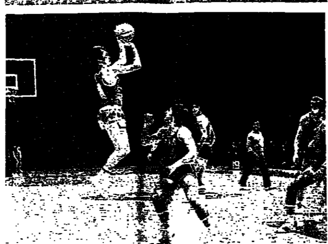
الجيش يترن مع المنتخب بكرة السلة

رياضيون القوات المسلحة في الجيش السورياني يستعدون هذه الأيام للمشاركة في دورتي التنس في بيروت وبيروت القديمتين ..